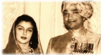
Gayatri Devi et le Maharajah de Jaipur

JOUR 5 : Avant d'entrée au Bhoutan nous ferons un petit crochet pour visiter un ancien état princier du raj britannique, le Cooch Bihar, où l'on pourra admirer notamment un palais extraordinaire témoin du faste dans lequel vivait la famille princière qui régnait sur ce territoire. La princesse Gayatrî Devi qui a épousé le Maharajah de Jaipur, Sawai Singh II, était originaire de Cooch Behar.