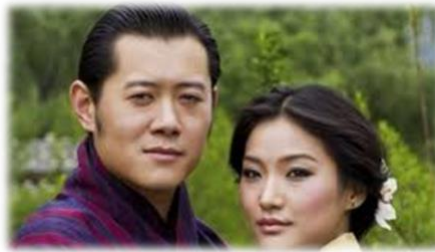
L'actuel couple royal

La télévision et internet ont été autorisés dans le pays seulement en 1999. Pour le reste, nous le découvrirons ensemble et nous pourrions en débattre en fonction de ce que nous observerons : est-ce que les Bhoutanais ont trouvé le secret du bonheur, sont-ils vraiment heureux ?