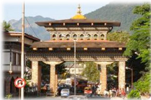
Phuentsholing, porte d'entrée du Bhoutan

Nous parviendrons à Phuentsholing en fin d'après-midi. Là débute notre voyage au Bhoutan. Phuentsholing est une grande ville qui doit sa prospérité aux échanges commerciaux entre l'Inde et le Bhoutan. Elle est le lieu d'un melting pot culturel avec une population composée d'Indiens et de Bhoutanais. Nuitée à Phuentsholing.