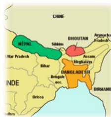
L'Inde du nord-est

L'Assam est l'un des sept états qui composent la partie nord-est de l'Inde. Toute cette région qui s'étend aux confins de l'Inde jusqu'à la frontière avec la Chine et le Myanmar (ex Birmanie), est un rêve de voyageur dans le sens où nous irons de découverte en découverte. C'est une région qui présente une diversité extrême de tout point de vue : ethnique (plusieurs peuples, plus d'une centaine de tribus), linguistique (plusieurs dizaines de langues et dialectes), faune (une faune rare, dont le rhinocéros unicorne et le langur doré) et une flore exubérante.