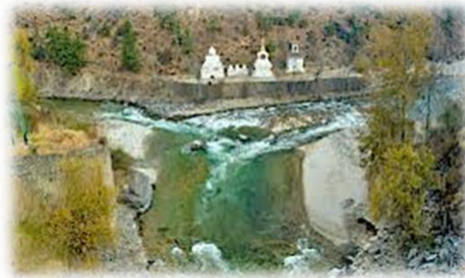
Au confluent des 2 rivières 3 chorten (ou stoupa)

Le trajet jusqu'à Thimphu (2 350 m), la capitale du Bhoutan, nous permettra d'admirer de magnifiques paysages. Sur notre route nous pourrons voir de nombreuses cascades. Nous ferons une halte à Chhuzom où se rejoignent deux rivières la Paro Chhu et la Thimphu (chhu signifie rivière et zom rencontre). L'endroit est aussi un grand carrefour routier où les paysans vendent leurs produits : légumes, pommes, fromage. Nous arriverons à Thimphu en fin d'après-midi. Nous pourrons commencer à visiter la ville et observer le style de vie de ses habitants.