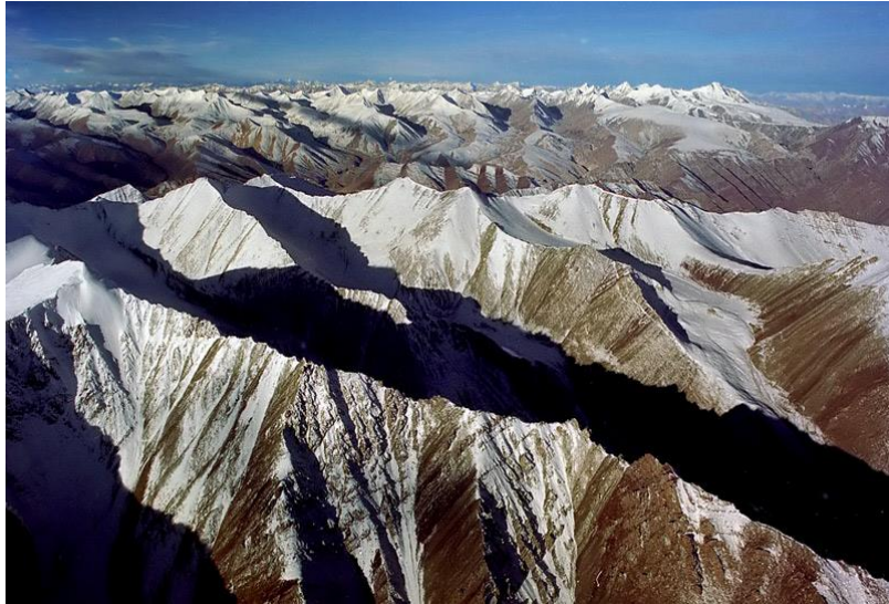
Survol de la chaîne himalayenne

JOUR 1 : Vol Delhi-Leh, un vol extraordinaire puisque nous survolons l'Himalaya. Arrivée à Leh. 1 ère journée d'adaptation à l'altitude. La capitale du Ladhak se situe à une hauteur de 3 500 m. Repos (pas d'efforts physiques pendant 2 jours) et découverte de la ville.