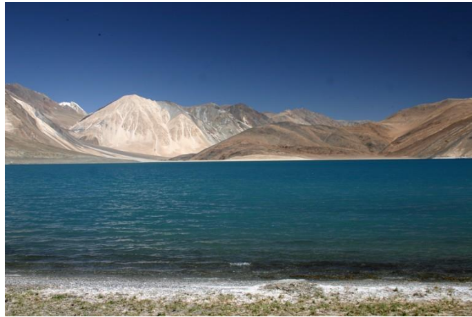
Le lac de Pangong Tso

JOUR 10. : Route vers le lac Pangong Tso - 5 heures de trajet. Sur le trajet possibilité de visiter le monastère de Sachakul. Nuit sous la tente.